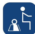
Poids max. utilisateur ▼